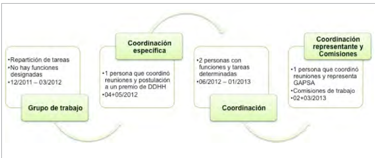
Esquema de las etapas en la estructura organizacional

En abril y mayo del 2012 designamos una persona para que asumiera la coordinación del grupo. En estos dos meses, las funciones de la coordinadora se limitaron a la coordinación interna y la gestión para la presentación de una solicitud al Premio en Derechos Humanos “Javier Pérez de Cuéllar”, otorgado por la Embajada de Francia en el Perú.